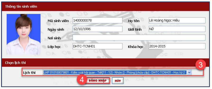
Hình 2. Màn hình hiển thị thông tin sinh viên đăng nhập

- Sau khi bấm nút Dảng NHập sẽ hiển thị màn hình đăng nhập thi 2.